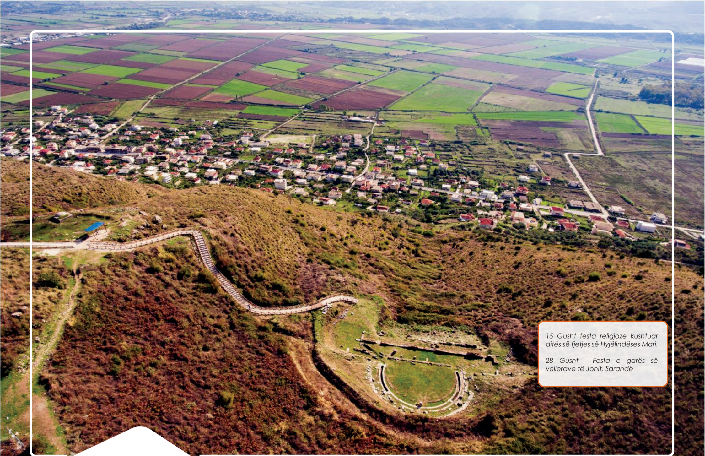
Parku Arkeologjik, Finiq

15 Gusht festa religjose kushtuar ditës së fjetjes së Hyjëlinadësës Mari.