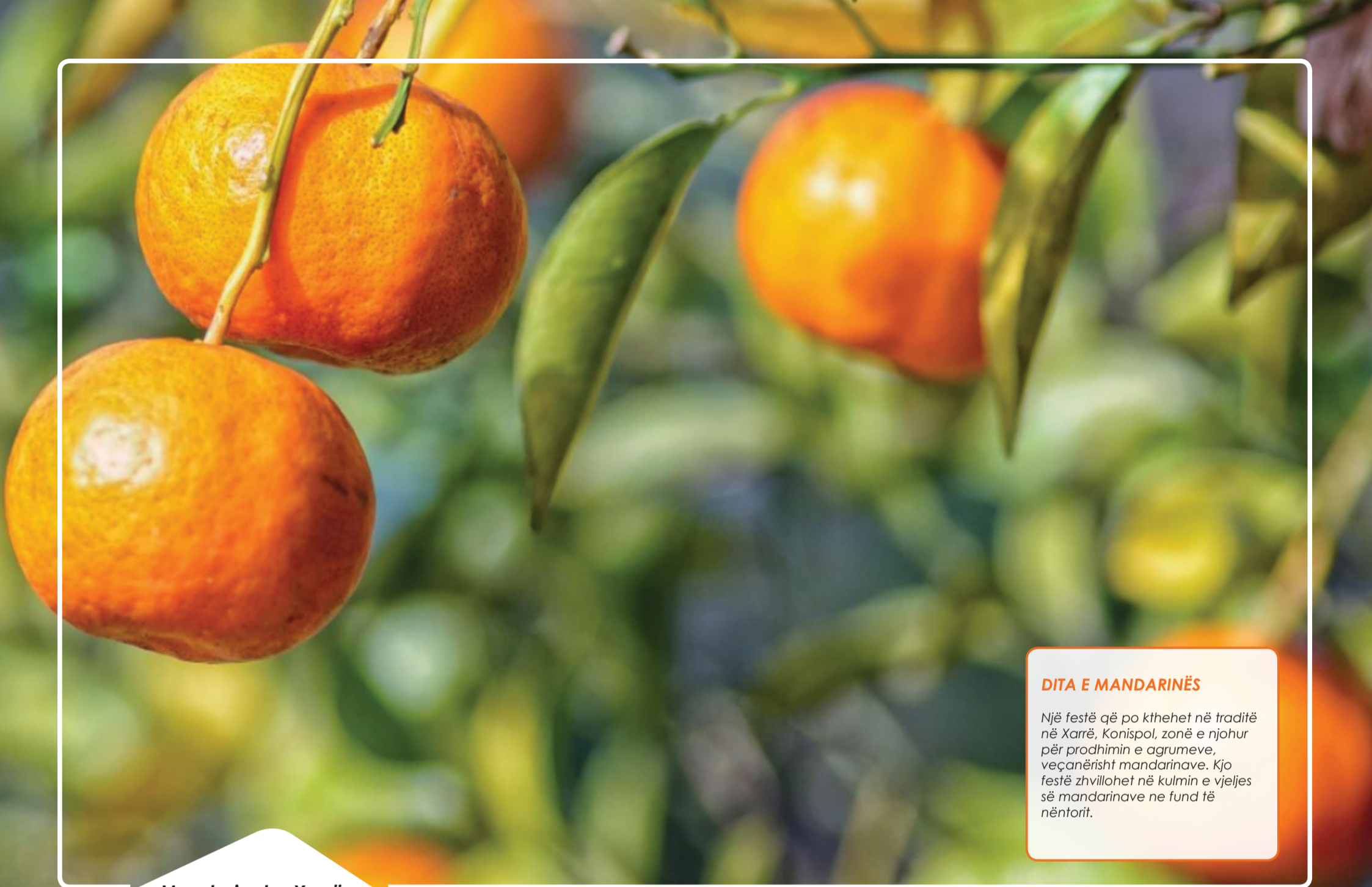
Mandarinat e Xarrës Konispol