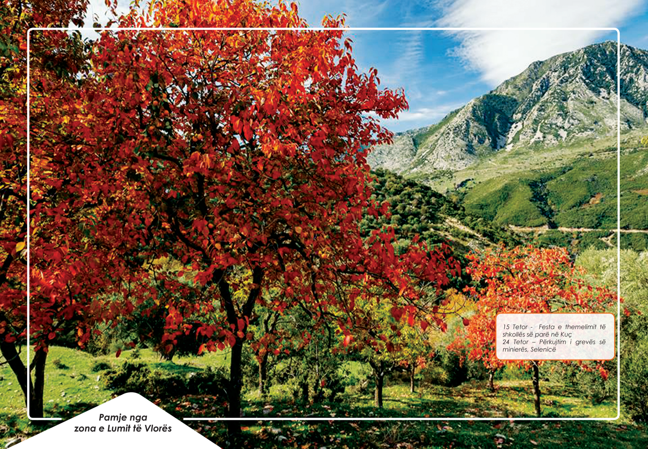
Pamje nga zona e Lumit të Vlorës

15 Tetor - Festa e themelimit të shkollës së parë në Kuç 24 Tetor - Përkujtim i grevës së minierës, Selenicë