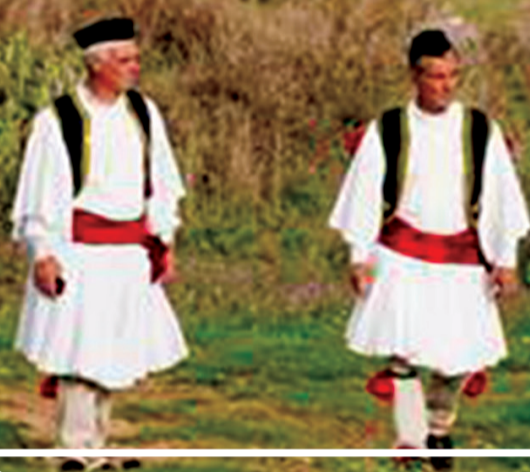
Pilur - Himarë

Territori i Qarkut Vlorë ka një kulturë të pasur tradicionale të jetesës e cila ka origjinën nga rajoni etno-kulturor i quajtur Labëri. Të gjitha këto tradita materializohen në shprehjet e tjera të kulturës, një prej të cilave është Isopolifonia. Kënga polifonike përbën një vlerë etnokulturore të veçantë, të vlerësuar në vitin 2005 si kryevepër e Trashëgimisë gojore dhe jo materiale Botërore nga UNESCO. Këto janë këngë të vjetra popullore të pashkruara, të trashëguara dhe të transmetuara gojarisht përmes të kënduarit nga një brez në tjetrin.