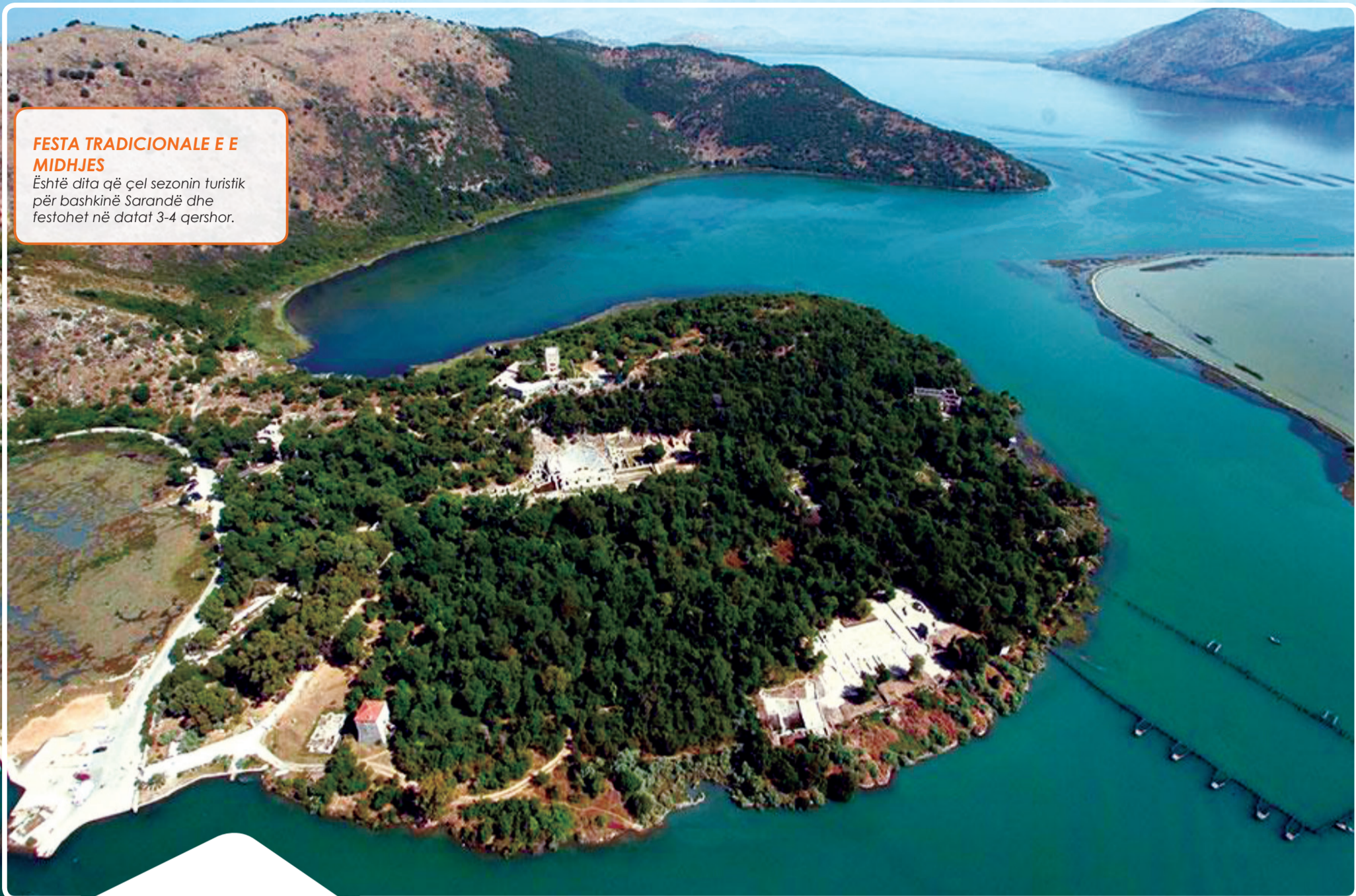
Parku i Butrintit, Sarandë

Është dita që çel sezonin turistik për bashkinë Sarandë dhe festohet në datat 3-4 qershor.